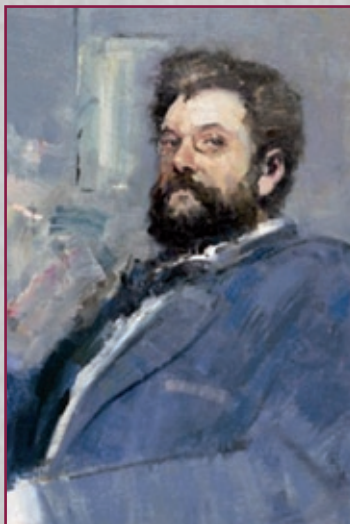
© Benjamin Chai nach Edouard Manet

Jeder Band enthält eine Einleitung des wissenschaftlichen Herausgebers, das Libretto, die Partitur, den kritischen Bericht und gegebenenfalls Anhänge. Damit schafft der Bärenreiter-Verlag die Basis, um das Repertoire gemäß den heutigen Ansprüchen in seiner Vielfalt den Theatern wieder zugänglich zu machen. Mit der Reihe L'Opéra français darf sich die Musikwelt auf die Entdeckung ungeahnter Schätze freuen!