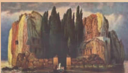
Cover painting by / Titelgemälde von / Tableau de couverture Ya. F. Zionglinsky, completed in / vollendet / terminé en 1908. Oil on canvas / Leinwand, Öl / Huile sur toile 71.5 x 90 cm. GTsMMK Coll. no 386/II