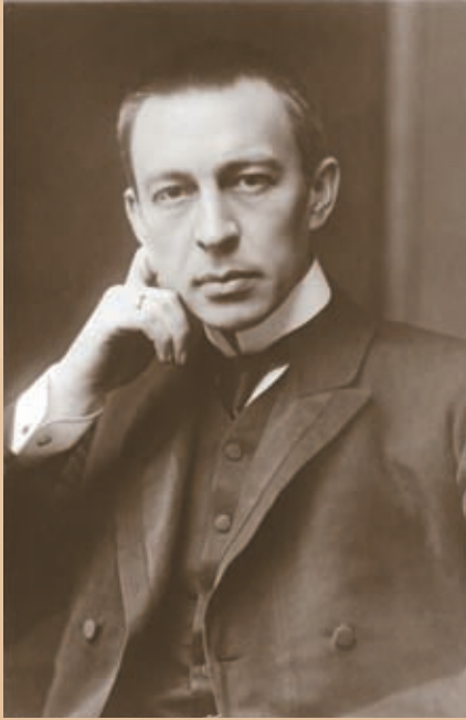
S. Rachmaninoff (1910)